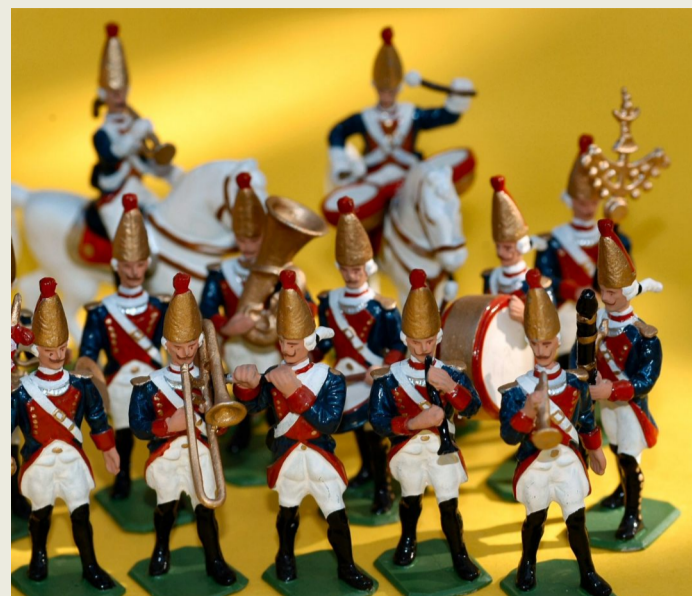
Preußens Glanz und Gloria en miniature.