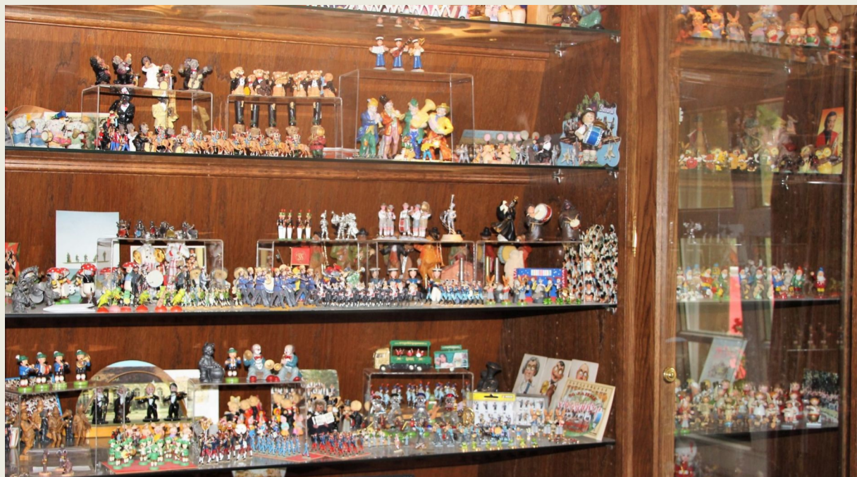
Ein kleiner Ausschnitt der Sammlung in der Wohnung des Grafen.