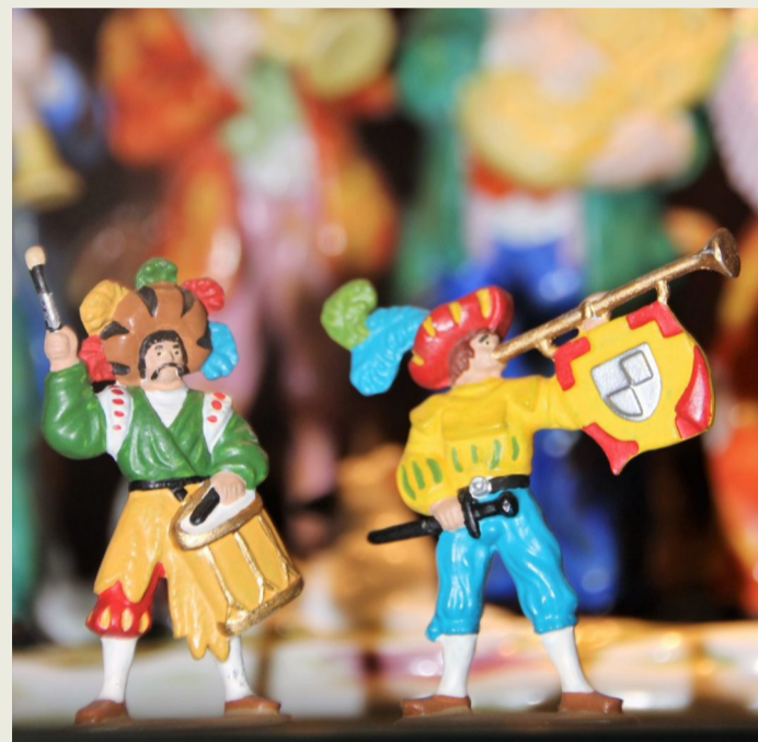
Musikalische Landsknechte aus Zinn sind farbenfrohe Hingucker.